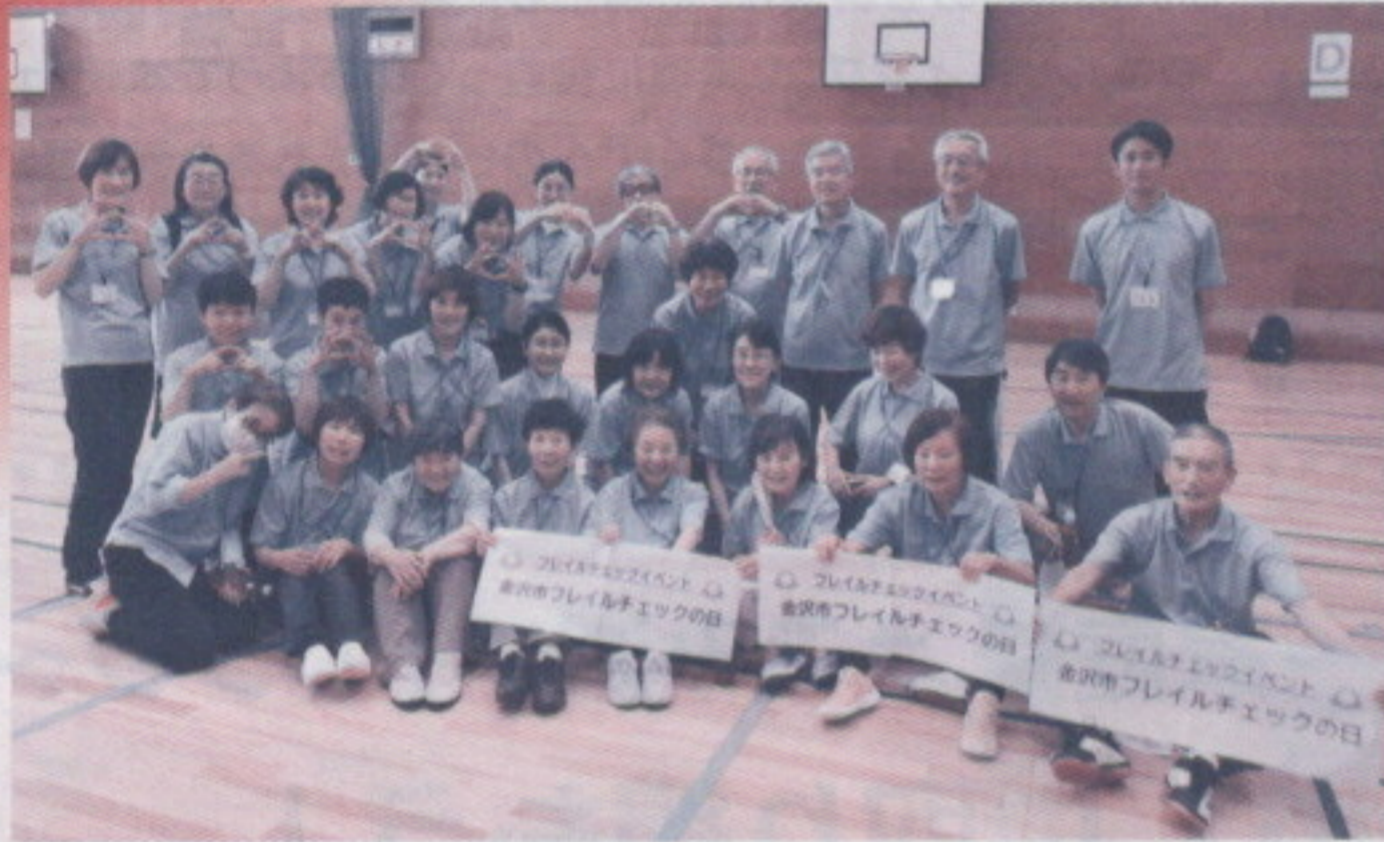
金沢市フレイルチェックの日