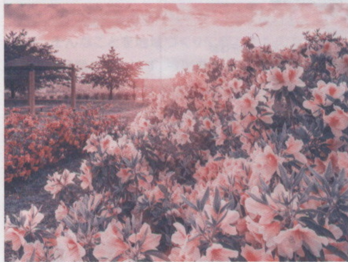
前回のグランプリ作品 「雨上がりのつつじ」大乗寺丘陵公園 林 裕晃

【応募先・お問い合わせ】 〒920-8577 金沢市広坂1丁目1番1号 金沢市役所緑と花の課内 緑を育て金沢を美しくする会事務局 電話 076-2220-2356