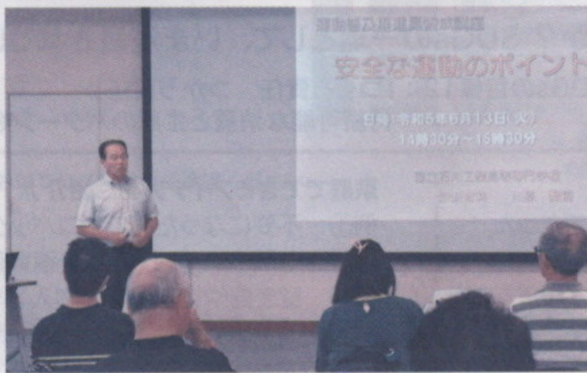
運動普及推進員養成講座